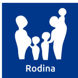
Obr. 1 - Piktogramy jednotlivých cílových skupin (pilířů podpory)